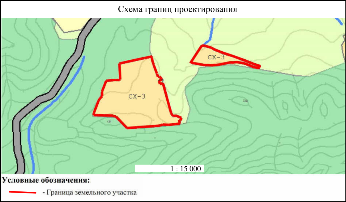
Основные технико-экономические показатели проекта межевания