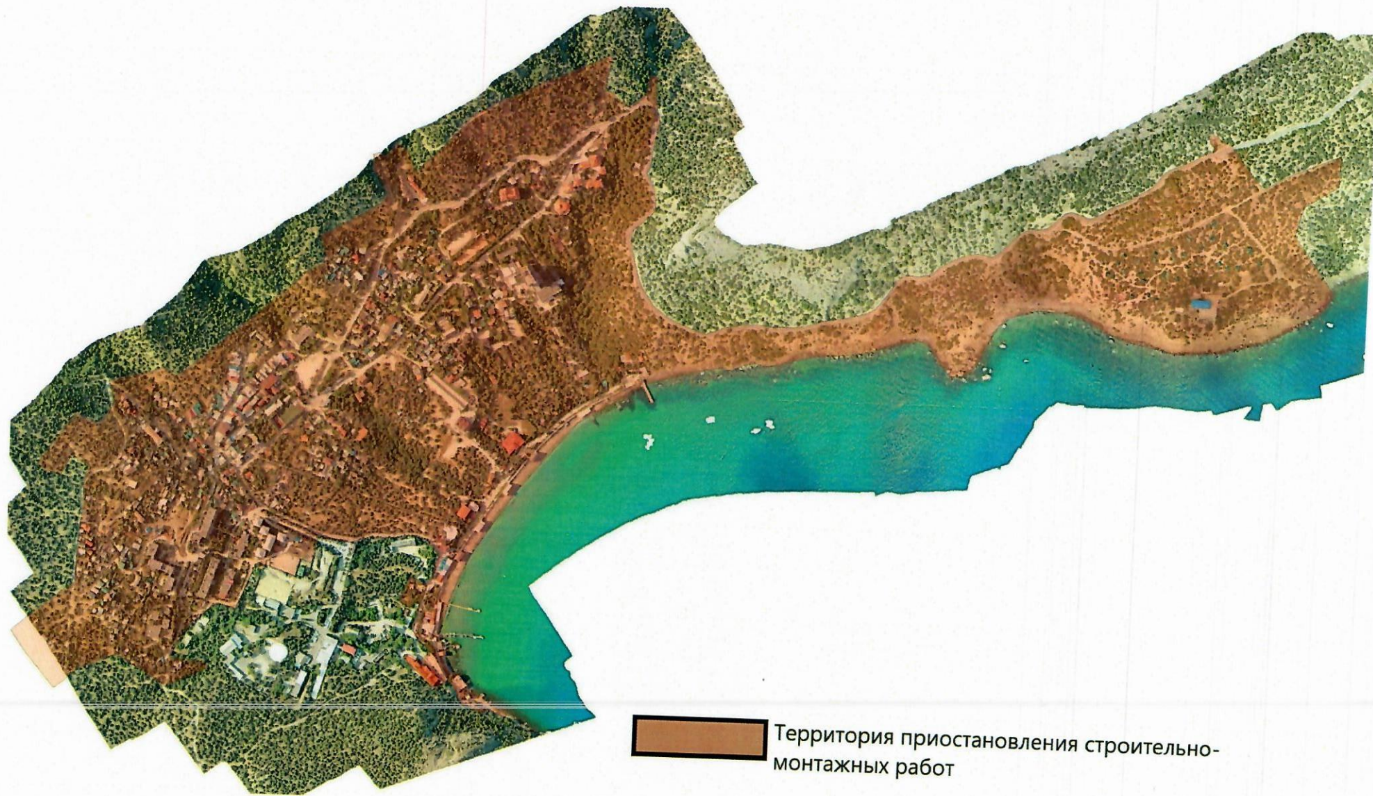
Схема «Территория приостановления строительно-монтажных работ в границах населенного пункта пгт. Новый Свет»

Приложение к постановлению администрации города Судак от 30.05.2024 № 704