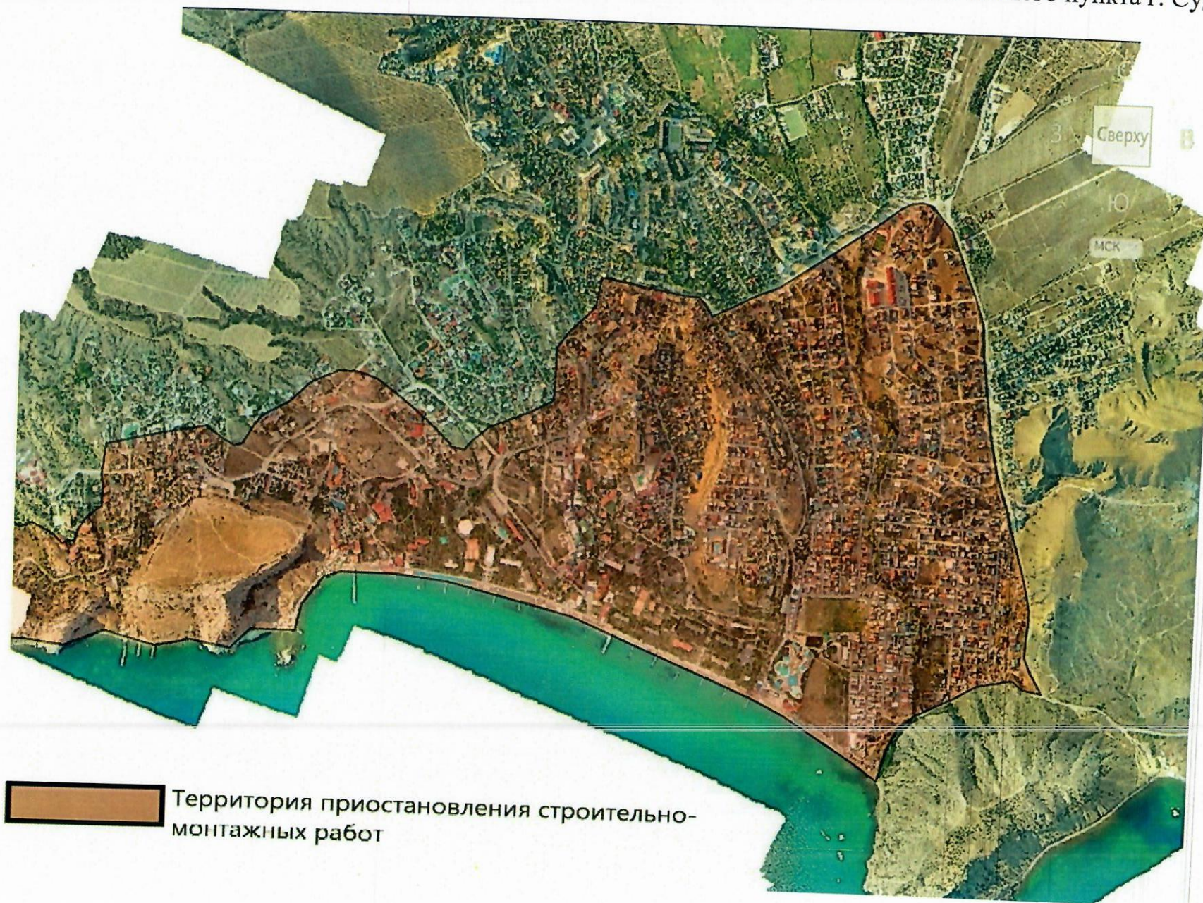
Схема «Территория приостановления строительно-монтажных работ в границах населенного пункта г. Судак»

Территория приостановления строительно-монтажных работ